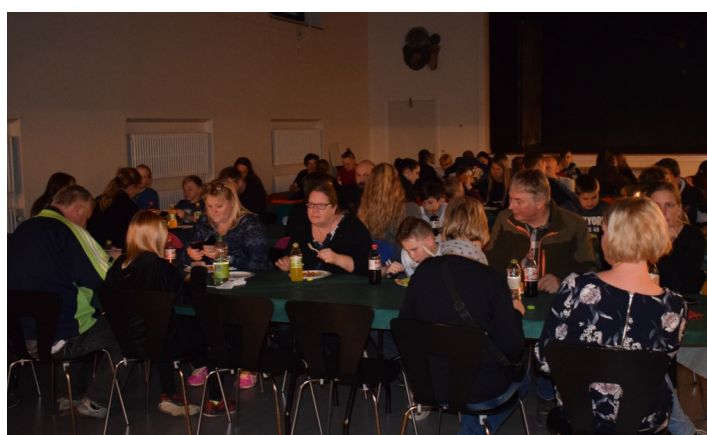
Lækker lasagne til årets skolefest

Mange af eleverne benyttede også skolefesten til at vise