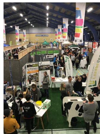
Bornholms Uddannelses Messe i Aakirkebyhallerne

Fredag sluttede udskolingen af med et virksomhedsbesøg på Hasle Klinker Refractories.