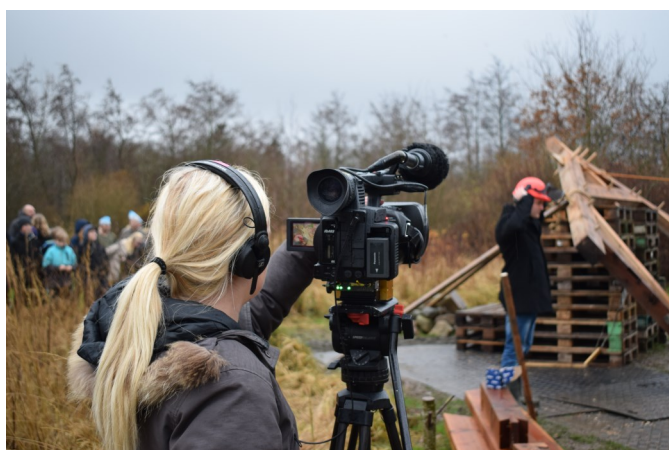
TV2/Bornholm var på pletten, da der var tømmerrejsning på bålhytten

have en bålhytte, som åbner sig ud mod tre områder med hver sit shelter. Det ene er en vikingebolig, som kan bruges i forbindelse med, at vi lærer børnene om vikingetiden. Det andet er en bronzealderbolig. Og det sidste er en mere nutidig amerikansk bjælkehytte. Det bliver et sted, hvor vi kan undervise i natur og miljø, og hvor vi har en flot udsigt over området.